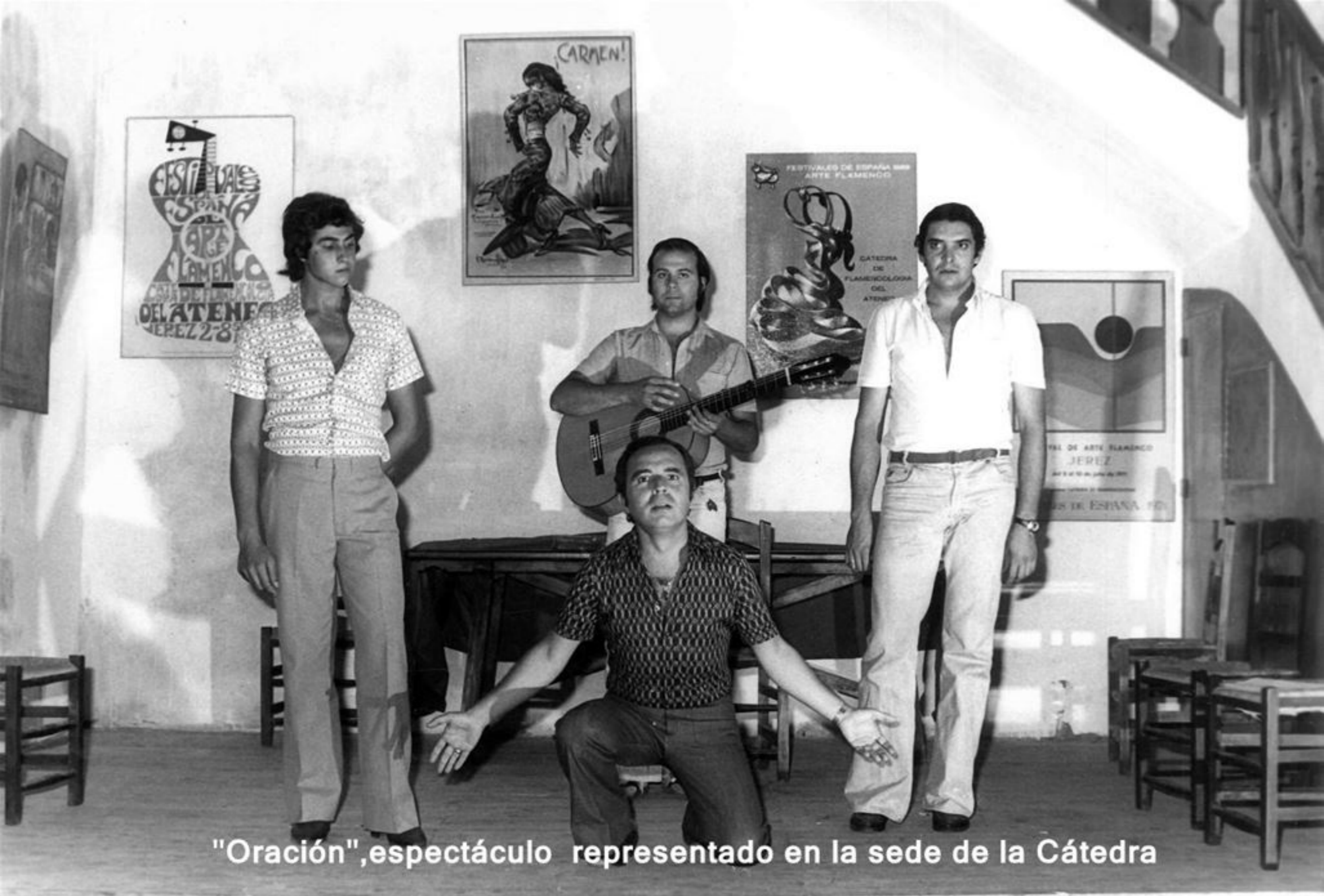
"Oración", espectáculo representado en la sede de la Cátedra